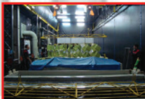
Linha de Líquido Penetrante Liquid Penetrant Inspection Line