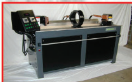
Máquina Estacionária Inspecção por Partículas Magnéticas Magnetic Particle - MP